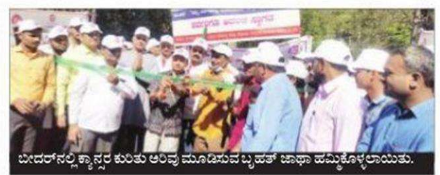
ಬೀದರದಲ್ಲಿ ಕ್ಯಾನ್ಸರ್ ಕುರಿತು ಅರಿವು ಮೂಡಿಸುವ ಬೃಹತ್ ಜಾಥಾ ಹಮ್ಮಿಕೊಳ್ಳಲಾಯಿತು.