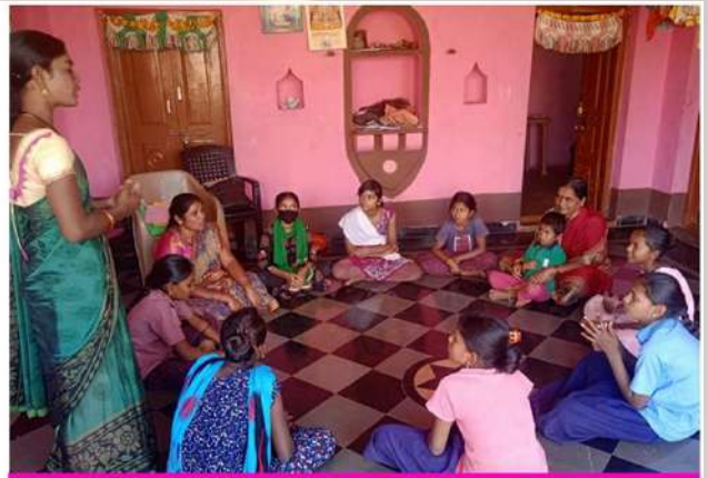
Jana Jagruti Manch